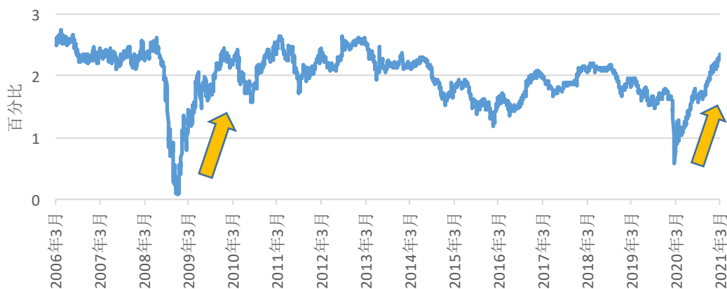
圖表 3：不斷上升的通脹預期—美國 10 年期均衡通脹率

數據截至 2021 年 3 月 26 日。指數表現基於以美元計的總回報。過去表現並非未來業績的保證。圖表僅供說明。